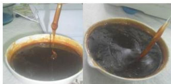
Gambar 1. Ekstrak aseton kulit buah dari Desa Simpang Agung (kiri) dan Desa Rengas Bandung (kanan)

Sampel kulit buah dari kedua lokasi penelitian menghasilkan rendemen ekstrak yang cukup tinggi yakni berkisar antara 17 sampai dengan 25 persen. Hasil rendemen yang tinggi menunjukkan kemungkinan senyawa-senyawa kimia yang terkandung dalam ekstrak tersebut juga tinggi. 11